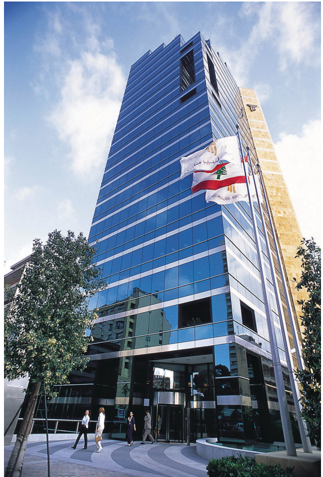
Byblose Pank, Liibanon