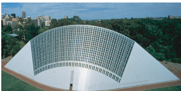
Bicentennial konservatoorium, Austraalia

Turvalisus on tänapäeval äärmiselt oluline töötajatele kindlustunde tagamiseks. Kaitske oma ehitist, selles viibijaid ning oma ettevõtte vara TAC lahendustega julgeoleku, sissepääsu kontrolli, videojälgitamise ning sisetelevisiooni alal.