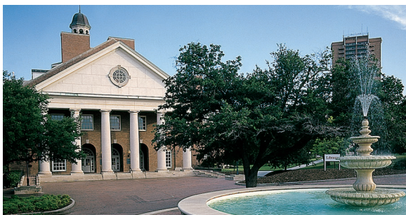
Texas Woman's University, USA