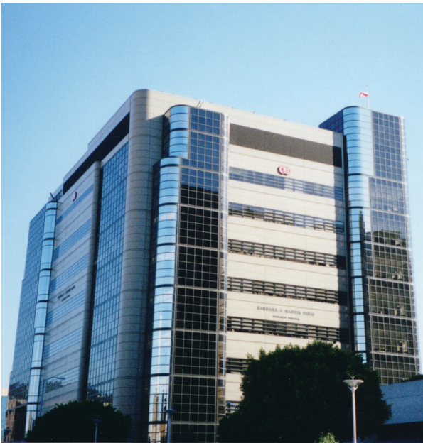
Cedars-Sinai Haigla, USA