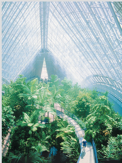
Bicentennial konservatoorium, Austraalia

Energeetikalahendused spetsialiseeruvad garantiilepingutele, mis võimaldavad Teil teha hoones uuendusi energia kokkuhoiu abil säästetud raha eest. TAC garantiilepingut kasutades saate Te efektiivsed vahendid oma hoone haldamiseks, mis on samas tagatud ka riskivaba garantiiga; kui säästus ei vasta mingil põhjusel garantiile, kirjutab TAC välja tšeki tekkinud vahe katmiseks. Tulemus? Ilma halduseelarvet muutmata saate Te uuendada tõrkuvat seadmestikku, vähendada hoolduskulusid, alandada kommunaalarveid ning suurendada hoones viibijate mugavust ning turvalisust.