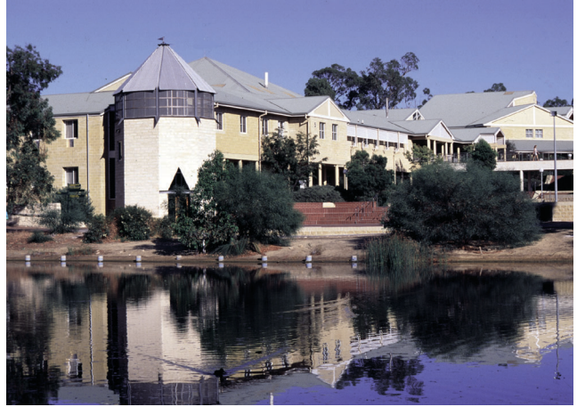
Edith Cowani Ülikool, Austraalia

Lisainformatsiooni saamiseks, täiusliku hoonelahenduse kohta, külastage meie kodulehte www.tac.com , et leida Teile lähim TAC esindaja.