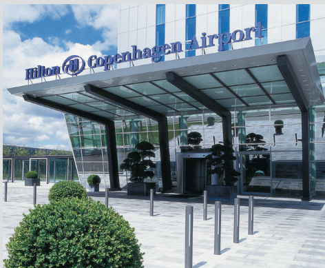
Hiltoni lennujaam Kopenhaagenis, Taani

Tundliku sisekliimaga keskkonnad , nagu näiteks hermeetilised ruumid ja katselaborid, vajavad täpset sisekliima juhtimist. TAC omab aastatepikkust kogemust täpset juhtimist vajavate keskkondade loomisel. Suudame tagada selle, et üliolulised faktorid, nagu temperatuur, niiskus ning õhuvahetus oleksid just sellised, nagu Teil on tarvis tundlike protsesside ja kontrollitud eksperimentide läbiviimisel.