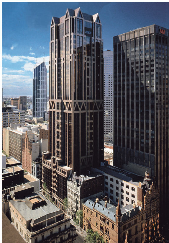
ANZ Pank, Austraalia

Tuleb tuttav ette? Te leiate vastused sellistele probleemidele ühest allikast -TAC.