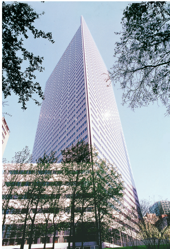
Lincoln Center, USA